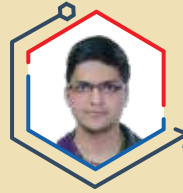
AIR 4 YASH JALUKA