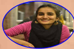
AIR - 93 GANDHARVA R.