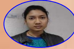
AIR - 230 MANALIKA