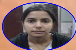
AIR - 646 SULEKHA