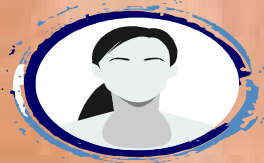
YOU CAN BE NEXT