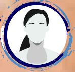
YOU CAN BE NEXT