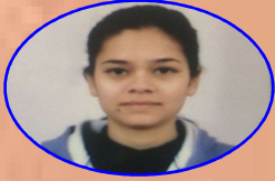
AIR - 212 GARIMAPANWAR