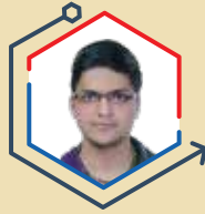
AIR 4 YASH JALUKA