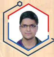
AIR 4 YASH JALUKA