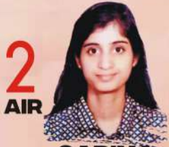
GARIMA LOHIA ALL INDIA TEST SERIES, PERSONALITY DEVELOPMENT

ISHITA KISHORE ABHYAAS, ESSAY TEST SERIES, PERSONALITY DEVELOPMENT