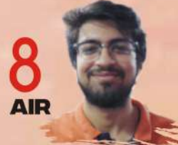
ANIRUDDH YADAV ALL INDIA TEST SERIES, ETHICS CASE STUDIES