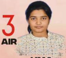
UMA HARATHIN ALL INDIA TEST SERIES, PERSONALITY DEVELOPMENT