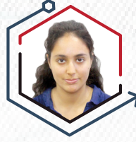
AIR 20 ANOUSHKA SHARMA