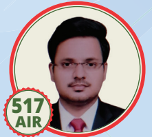
no'sk i kj'k kj