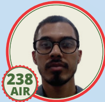
fofi u ncs