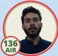
vfi z dckj