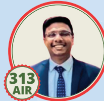
e; d nçs