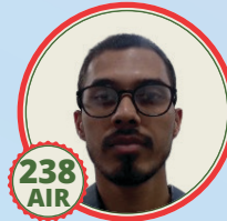
fofi u nçs