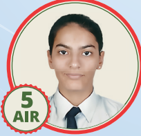
5 AIR Ruhani