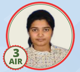
3 AIR Uma Harathi N